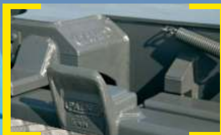
Suportes p/ Contentores