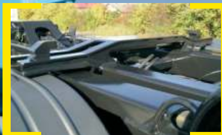
Bloqueio p/ Contentores