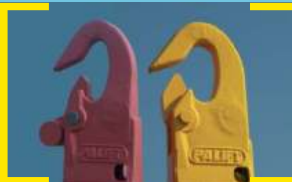
Mecânico ou Pneumático / GANCHO