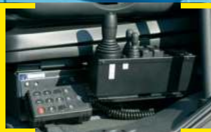
Comando na Cabine