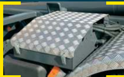
Cobertura em Alumínio